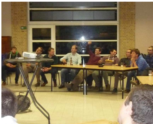
activiteit de slimste groene kringer