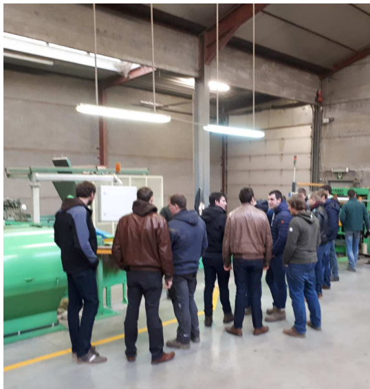
Een bezoek aan een vlasbedrijf