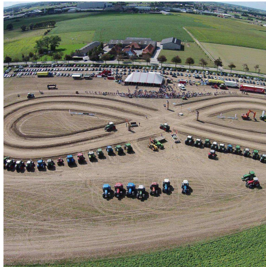
1e editie tractorrace